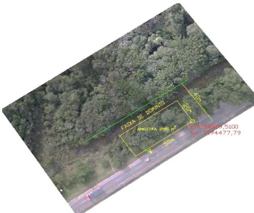
Figura 1 - Exemplo da delimitação da área amostral dentro da faixa de domínio do trecho da estrada BR 116/RS em estudo.

Para o levantamento florístico e coleta das informações dendrométricas foram instaladas 13 parcelas de 1.000 m 2 (20 m x 50 m). A Figura 1 exemplifica a delimitação da área amostral.